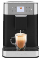
أسود بلون حديد الزهر